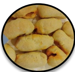
Jueves de Lardero