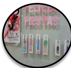
San Roque y San Ezequiel