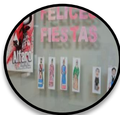
San Roque y San Ezequiel